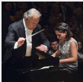
Zubin Mehta, Beatrice Rana (2014)