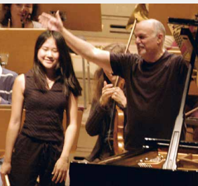
Yuja Wang, David Zinman (2003)