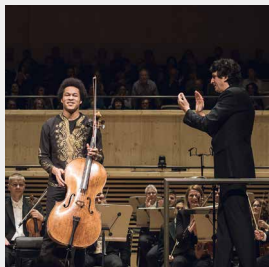
Sheku Kanneh-Mason, Michael Sanderling (2018)