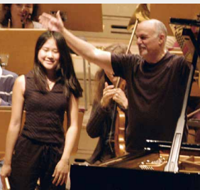
Yuja Wang, David Zinman (2003)

2018 fand das erste gemeinsame Konzert der Müller-Möhl Foundation und der Orpheum Stiftung statt. Seither wurde die Zusammenarbeit intensiviert und weiterentwickelt. Das geteilte Anliegen der Förderung von Frauen in der klassischen Musik findet seit 2024 unter dem gemeinsamen Label «Women in Classical Music» Ausdruck.